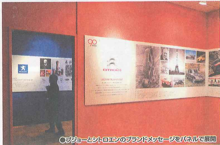
○プジョーとシトロエンのブランドメッセージをパネルで展開

プジョー・シトロエン・ジャポンでは、世界的に活躍しているアーティストのアガット・ド・バイヤンクール氏とのコラボを実現。プジョー・ランドの主力モデルである「207」シリーズに電動開閉式メタルルーフを装備し、クーペとカプリオレを自在に楽しめるフル4シーターモデル「207CC」にバイヤン